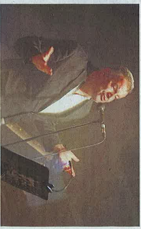
Le poète Magyd Cherfi a séduit dimanche soir le public avec un humour contagieux.

ANGOULÊME Le festival a atteint le cap espéré des 6 000 spectateurs payants dimanche