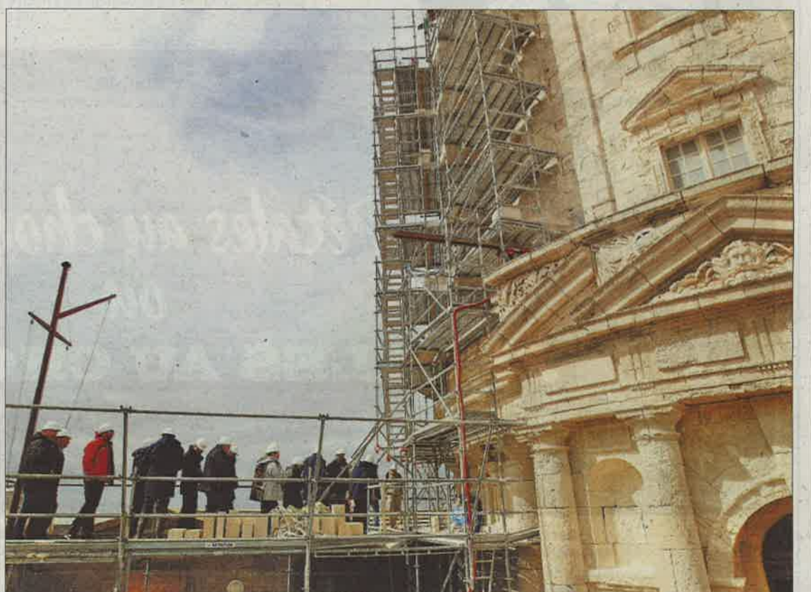
Les échafaudages et le matériel sont convoyés par hélicoptère