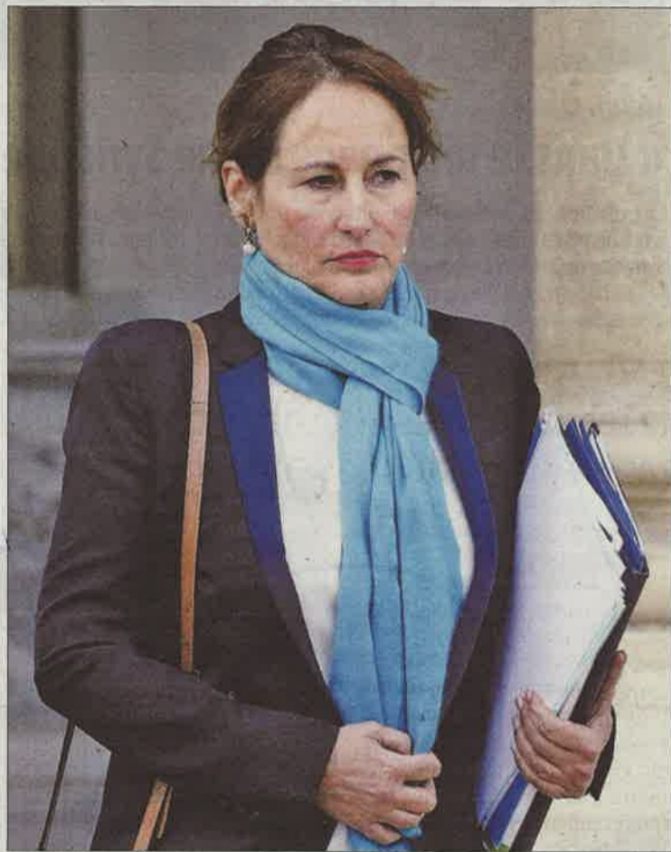
Ségolène Royal a été présidente de l'ancienne région Poitou-Charentes jusqu'en avril 2014.