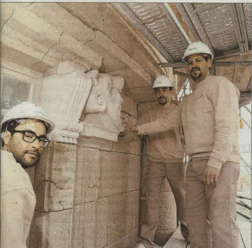
Les Compagnons de Saint-Jacques se battent presque pour travailler à Cordouan

(2) Smiddest : Syndicat mixte pour le développement durable de l'estuaire de la Gironde, qui, depuis 2010, assure la gestion du phare, propriété de l'État.